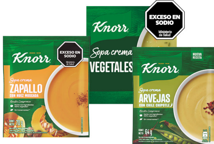
Sopa crema KNORR , varios sabores, 60, 64 o 70 g

Disponibles (u.): 32.000 El kg $ 17.368,42 PRECIO SIN IMPUESTOS NACIONALES: $ 818,18