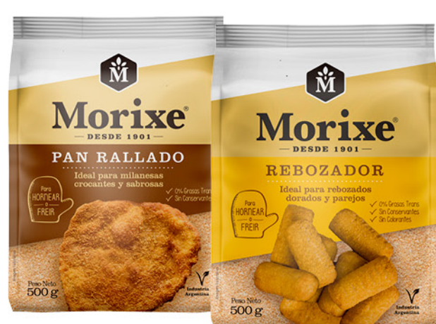
Pan rallado o Rebozador MORIXE , 500 g

Disponibles (u.): 8.600 PRECIO SIN IMPUESTOS NACIONALES: $ 1.348,42