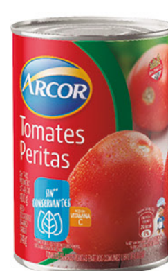
Tomates peritas ARCOR , enteros, 400 g

Disponibles (u.): 7.900 El kg $ 2.500,00 PRECIO SIN IMPUESTOS NACIONALES: $ 1.033,06