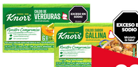
Caldo en cubos KNORR , Verduras o Gallina, 6 u, 57 g

Disponibles (u.): 5.300 PRECIO SIN IMPUESTOS NACIONALES: $ 983,47