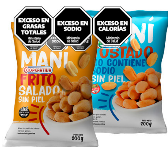
Mani COOPERATIVA , frito salado, sin piel o ECOOP , sin piel, sin sodio agregado, 200 g

Disponibles (u.): 14.000 60 g - El kg $ 26.500,00 70 g - El kg $ 22.714,29 PRECIO SIN IMPUESTOS NACIONALES: $ 1.314,05