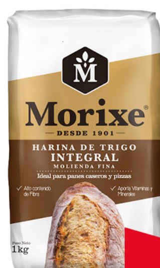
Harina de trigo MORIXE , Integral, Molienda fina, 1 kg

Disponibles (u.): 3.800 PRECIO SIN IMPUESTOS NACIONALES: $ 1.314,05