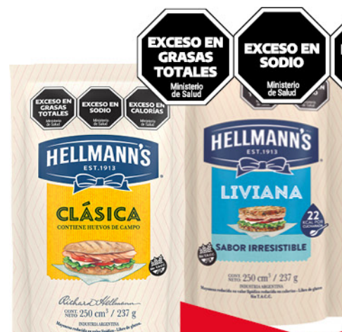
Mayonesa HELLMANN'S , Clásica o Liviana, doy pack, 237 g