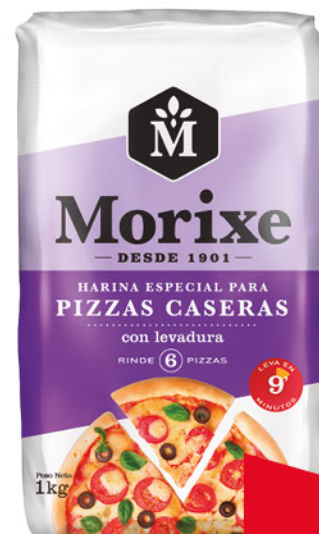
Harina MORIXE , Especial para Pizzas caseras, con levadura, 1 kg

Disponibles (u.): 9.100 PRECIO SIN IMPUESTOS NACIONALES: $ 1.076,92