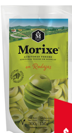
Aceitunas MORIXE , verdes, en Rodajas, 150 g

Disponibles (u.): 2.600 El kg $ 9.944,44 PRECIO SIN IMPUESTOS NACIONALES: $ 1.479,34