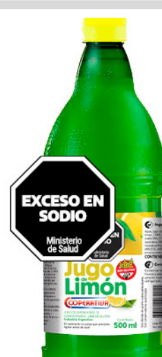
Jugo de Limón COOPERATIVA , 500 cm3