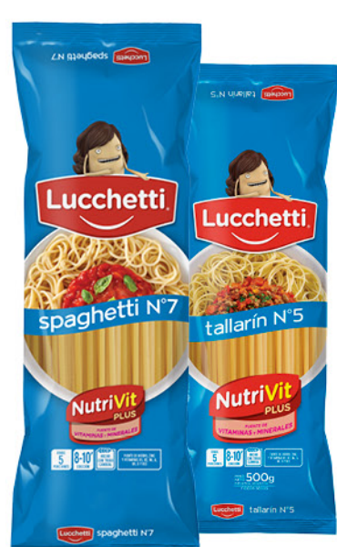
Fideos LUCCHETTI , spaghetti N°7 o tallarin N°5, 500 g

Disponibles (u.): 1.000 El kg $ 3.147,50 PRECIO SIN IMPUESTOS NACIONALES: $ 1.040,50