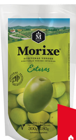
Aceitunas MORIXE , verdes, Enteras, 180 g

Disponibles (u.): 18.000 El kg $ 4.599,16 PRECIO SIN IMPUESTOS NACIONALES: $ 900,83