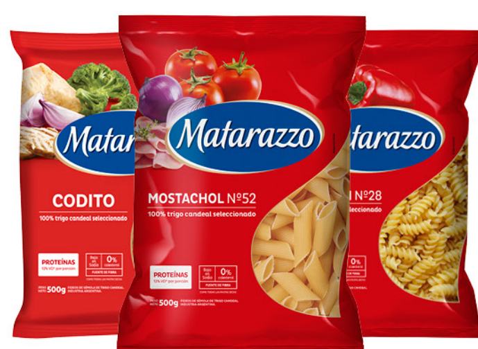
Fideos MATARAZZO , guiseros, Codito, Mostachol N° 52, Penne Rigate N° 48 o Tirabuzón N° 28, 500 g

Disponibles (u.): 28.000 El kg $ 2.378,00 PRECIO SIN IMPUESTOS NACIONALES: $ 982,64