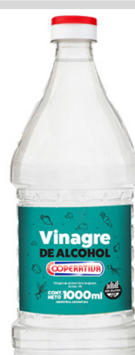
Vinagre de Alcohol COOPERATIVA , sin gluten, 1 L

Disponibles (u.): 4.000 El L $ 21.960,00 PRECIO SIN IMPUESTOS NACIONALES: $ 4.537,19