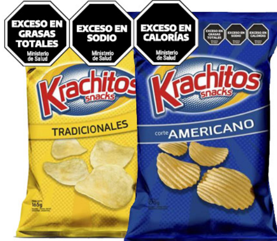
Papitas fritas KRACHITOS , Tradicionales o Corte Americano, 165 g

Disponibles (u.): 7.100 El kg $ 9.950,00 PRECIO SIN IMPUESTOS NACIONALES: $ 1.644,63