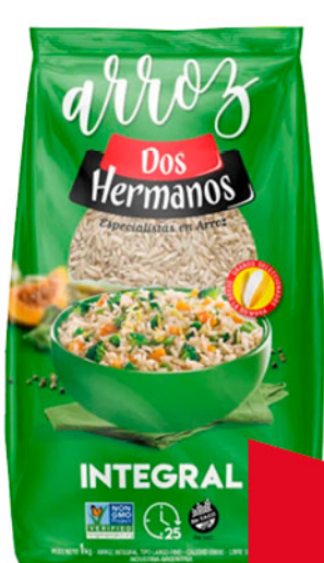
Arroz Integral DOS HERMANOS , 1 kg